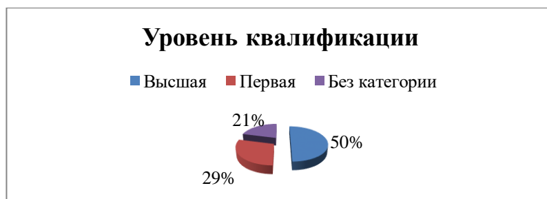
Рис. 3. Уровень квалификации педагогических работников.

Основной состав Организации представляют педагоги, проработавшие свыше 10 лет.